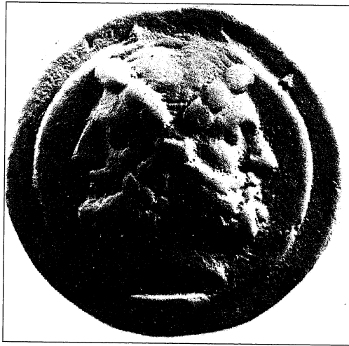
Moeda com o deus romano Jano e seus dois rostos. É de Jano que vem o nome do mês de janeiro.